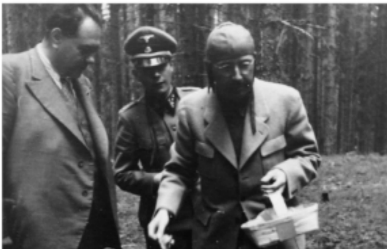
HEINRICH HIMMLER ehti Suomen matkalleen sisestämään Tyrväänön metsän hierojansa Felix Kerstenin kanssa.

Kersten tajusi ennen pitkää, että hänellä oli odottamattoman suuri vaikutusvalta SS-valtakunnajohtajana. Samalla Kersten väliitti hierontapöydällä saamiaan