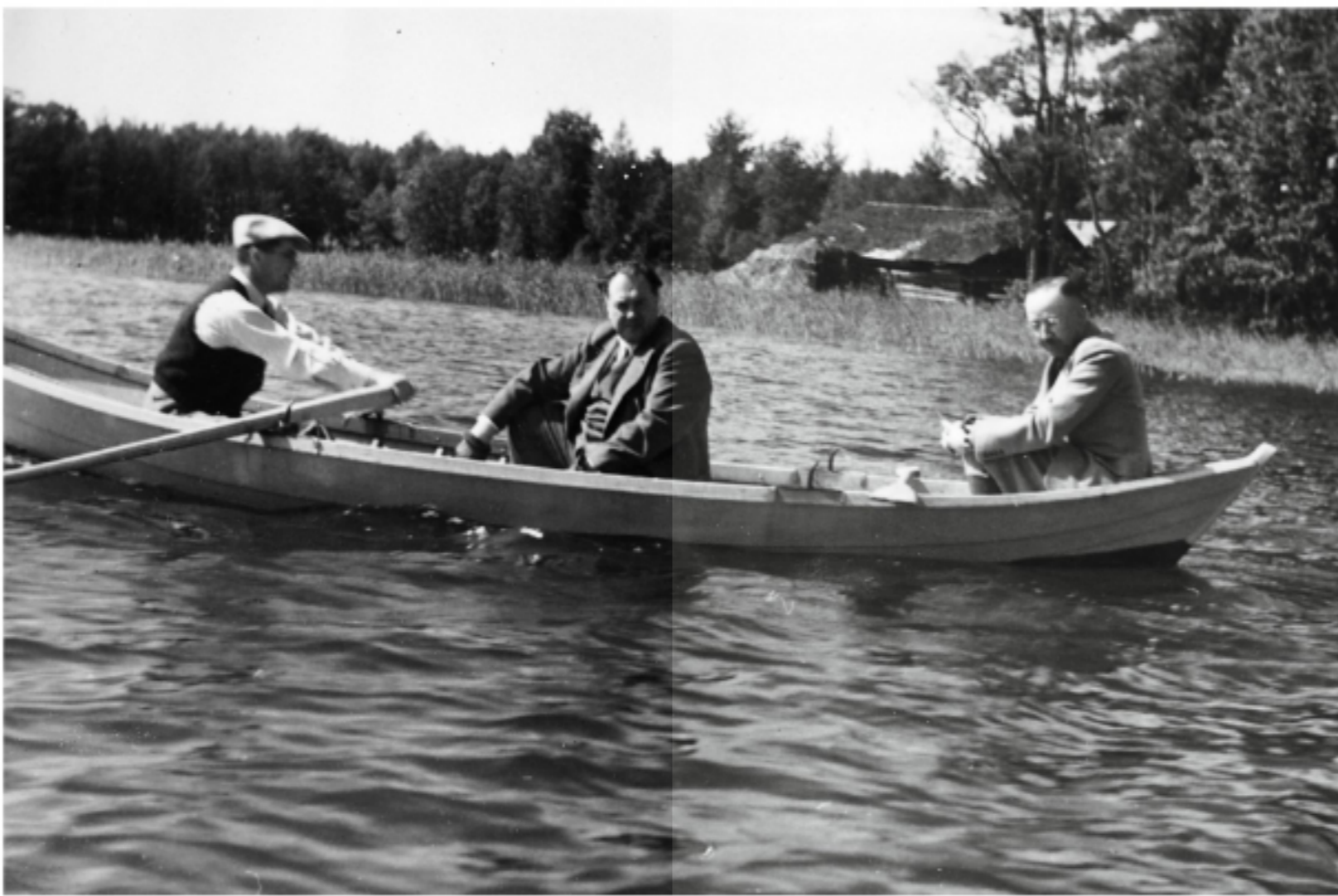
SS-JOHTAJA Heinrich Himmler (oik.) kävi soturetkellä pääministeri Jukka Rangellin (vasen) ja henkilökohtaisena Felix Kerstenin kanssa Luopioissa kesällä 1942. Himmler teki huoloin Suomeen yhdistetyn kasa- ja työmatkan.